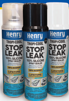
Disponible en color transparente, negro y blanco

es una solución de reparación 100% de silicona en aerosol formulada para proveer un sello a prueba de goteras permanente en una variedad de superficies.