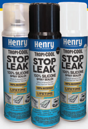
Available in clear, black and white

Henry® Tropi-Cool® Stop Leak® 100% Silicone Spray Sealer is a 100% silicone aerosol repair solution, formulated to provide a permanent leak-proof seal on a variety of surfaces.