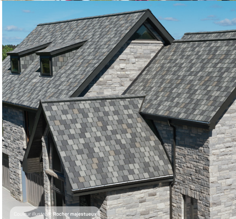
Couleur illustrée: Rocher majestueux

Chaque mélange de couleurs est une symphonie de teintes recréant les variations naturelles d'une ardoise de première qualité. Avec leur pureau grand format, ces bardeaux créeront sur votre toit un effet ardoisé percutant. De plus, leur prix abordable sera une douce musique à vos oreilles.