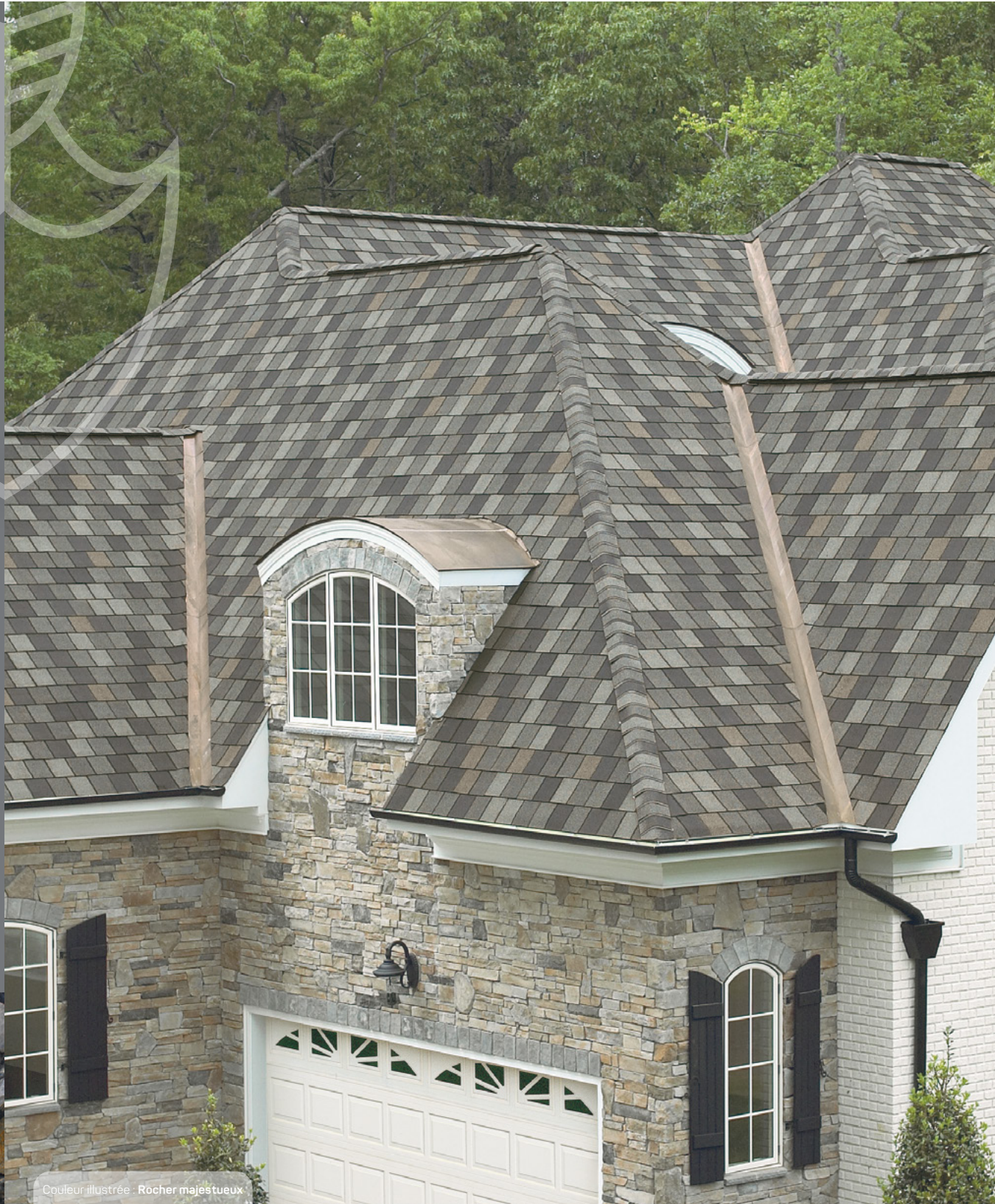
Couleur illustrée : Rocher majestueux