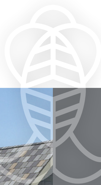
Couleur illustrée : Rocher majestueux