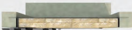
Ensamble de muro completo, recubrimiento mínimo 12"

Estos productos también ofrecen un desempeño óptimo en ensambles acústicos, así como en aplicaciones para el aislamiento de equipo mecánico.