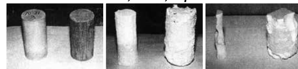
Antes de la Inmersión 5 Semanas Después 10 Semanas Después

El mortero tratado con Xypex y otro sin tratamiento se sometieron a prueba de resistencia al ácido siendo expuestos a una solución de 5% H 2 SO 4 durante 100 días. Xypex disminuyó la erosión del concreto hasta 1/8vo respecto a las muestras de referencia.